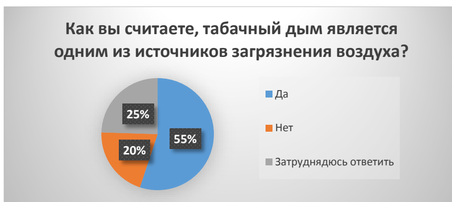
Рис.2 Вопрос тестирования

В наше время автомобильный транспорт является одним из главных видов источников загрязнения атмосферного воздуха. На вопрос «Способны ли электромобили сократить проблему с загрязнением атмосферы?» 37% респондентов ответили, что это отличная альтернатива автомобилям с двигателями внутреннего сгорания, а 30% считают, что электромобили никак не смогут повлиять на решение загрязнения атмосферы.